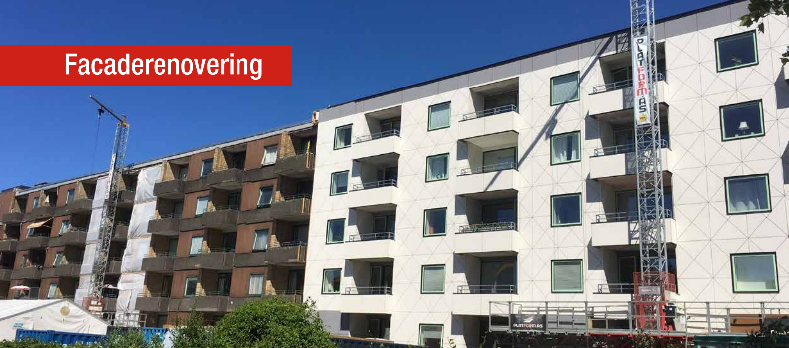
Et øjebliksbillede i byggeforløbet.