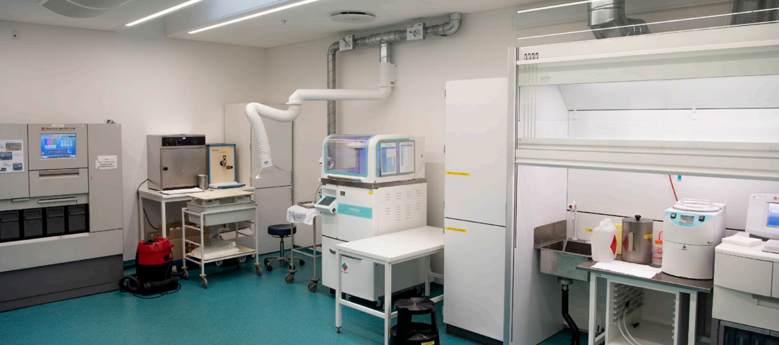
Herlev Hospital – Patologisk Afdeling