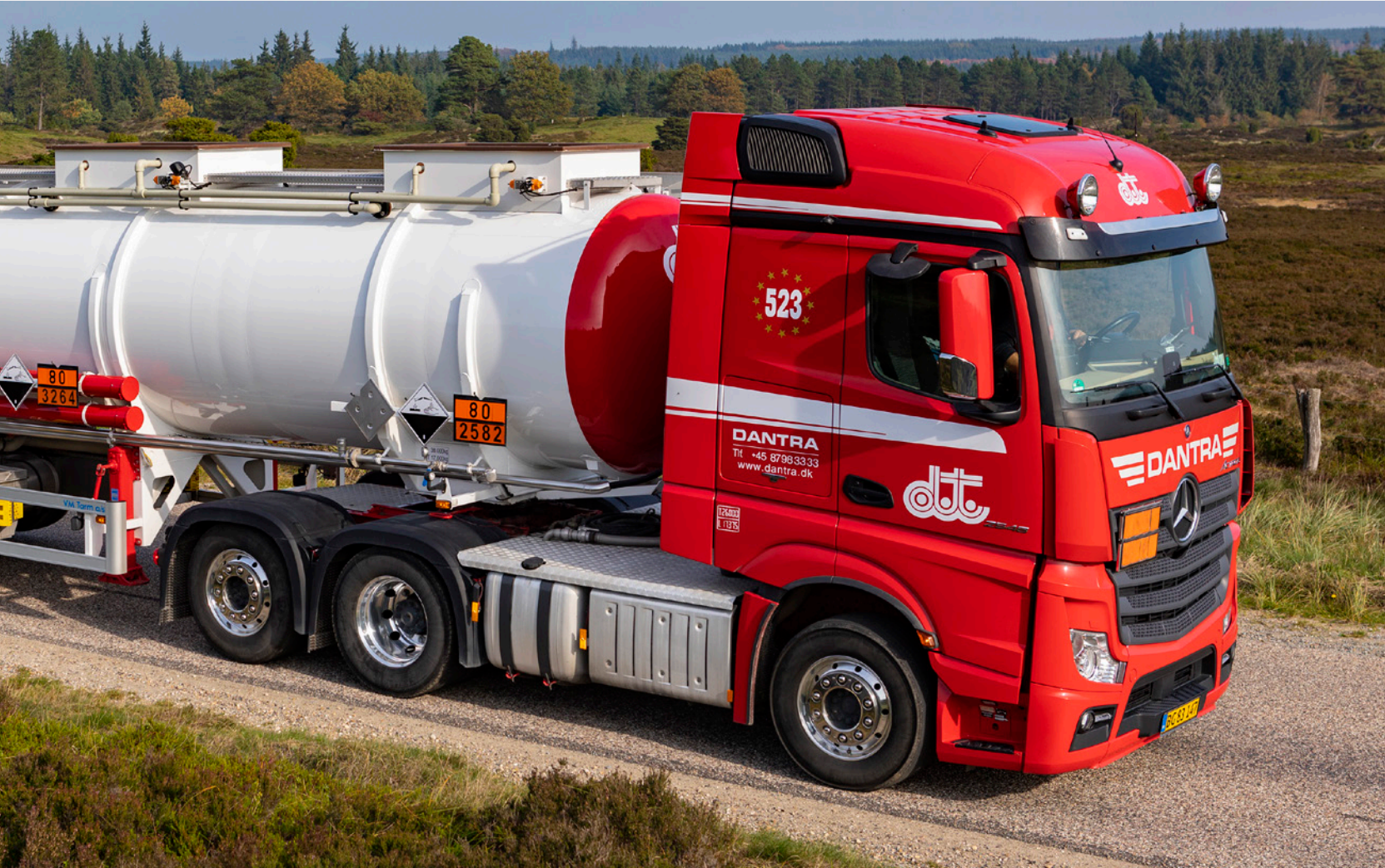
En coated tankvogn til kemikørsel.