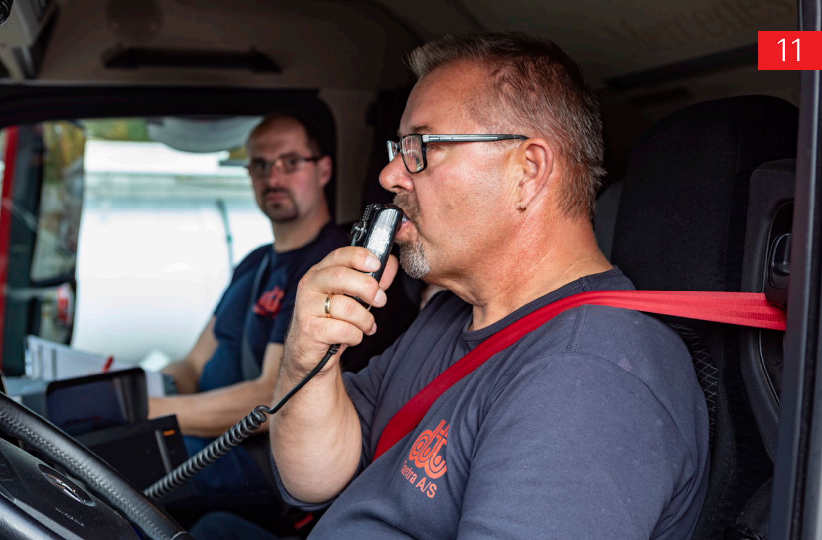
Chauffør og masterdriver betjener alkohollås.