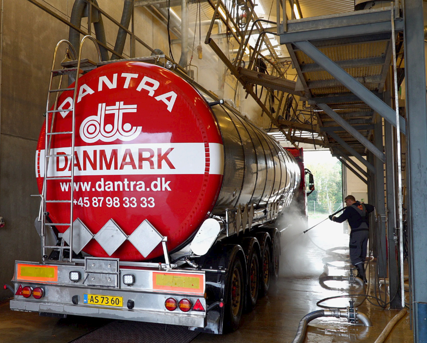
Tankrensning af tankvogn.