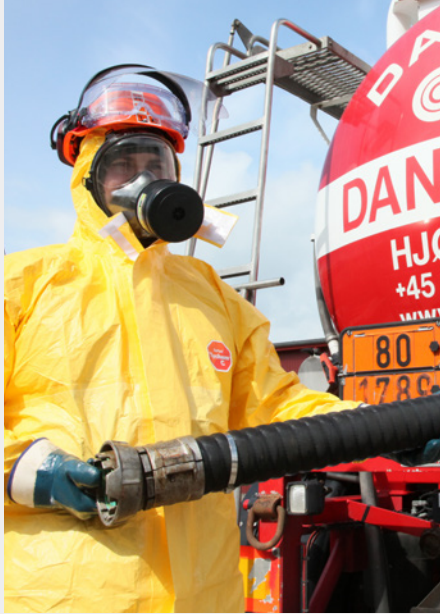
Chauffør i særligt kemisk beskyttelsesudstyr.