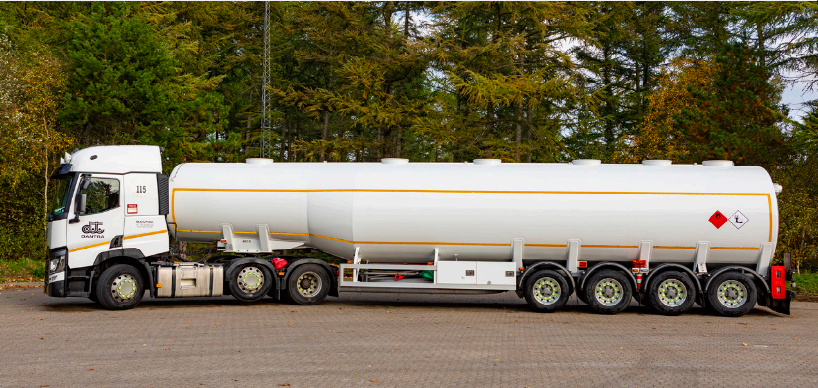
Benzin- og olielastbil.